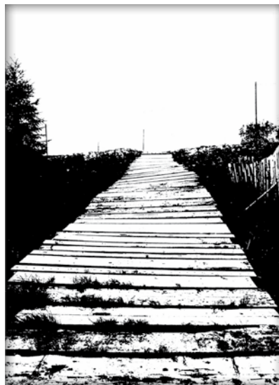
«А я иду по деревянным городам...». Кемь. «And I am walking on wooden cities...». Kem'.