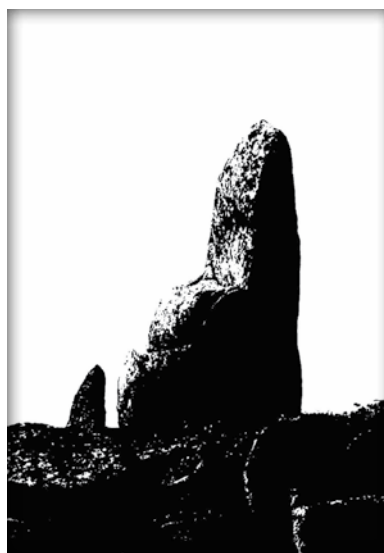
Трон, Кузова, Беломорье. Throne. The Kuzova, the Belomorje.