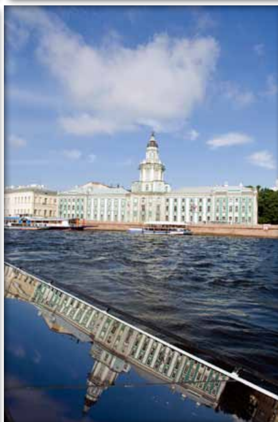
1 – 4. Из серии «Отражённый Петербург». 1 – 4. From the series «Reflected Petersburg».