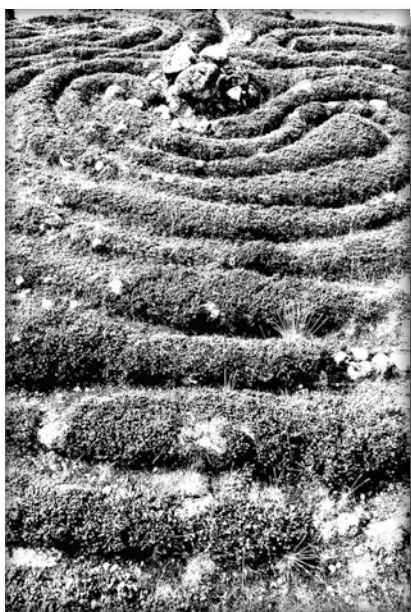
Лабиринт. Заячий остров. Беломорье. Labyrinth. The Zayachy Island. The Belomorje.